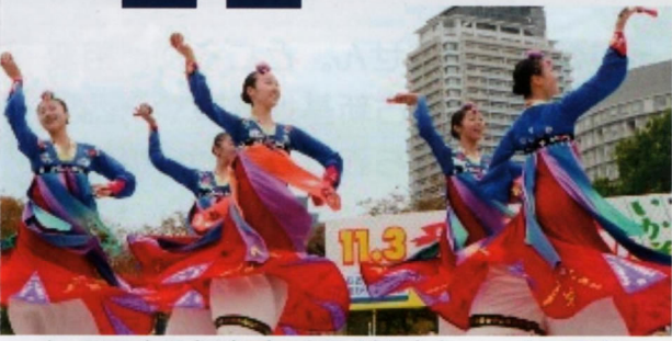
大阪朝鮮高級学校 舞踏