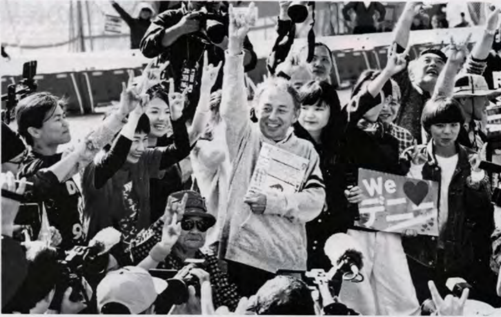
辺野古埋め立て海域への土砂投入開始から「夜明け、米軍キャンプ・シユウアのゲート前を訪れて歌声に込める玉城デモ」知事（中央）＝沖縄県名護市で15日午前11時15分

■賛同費 団体：1口 3000円 個人：1口 1000円 ■郵便振込先： 00920-7-236371 しないさせない戦争協力 関西ネットワーク