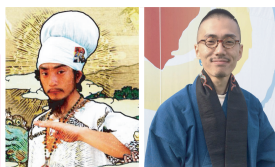
JAH MELIK&DON 弥五郎