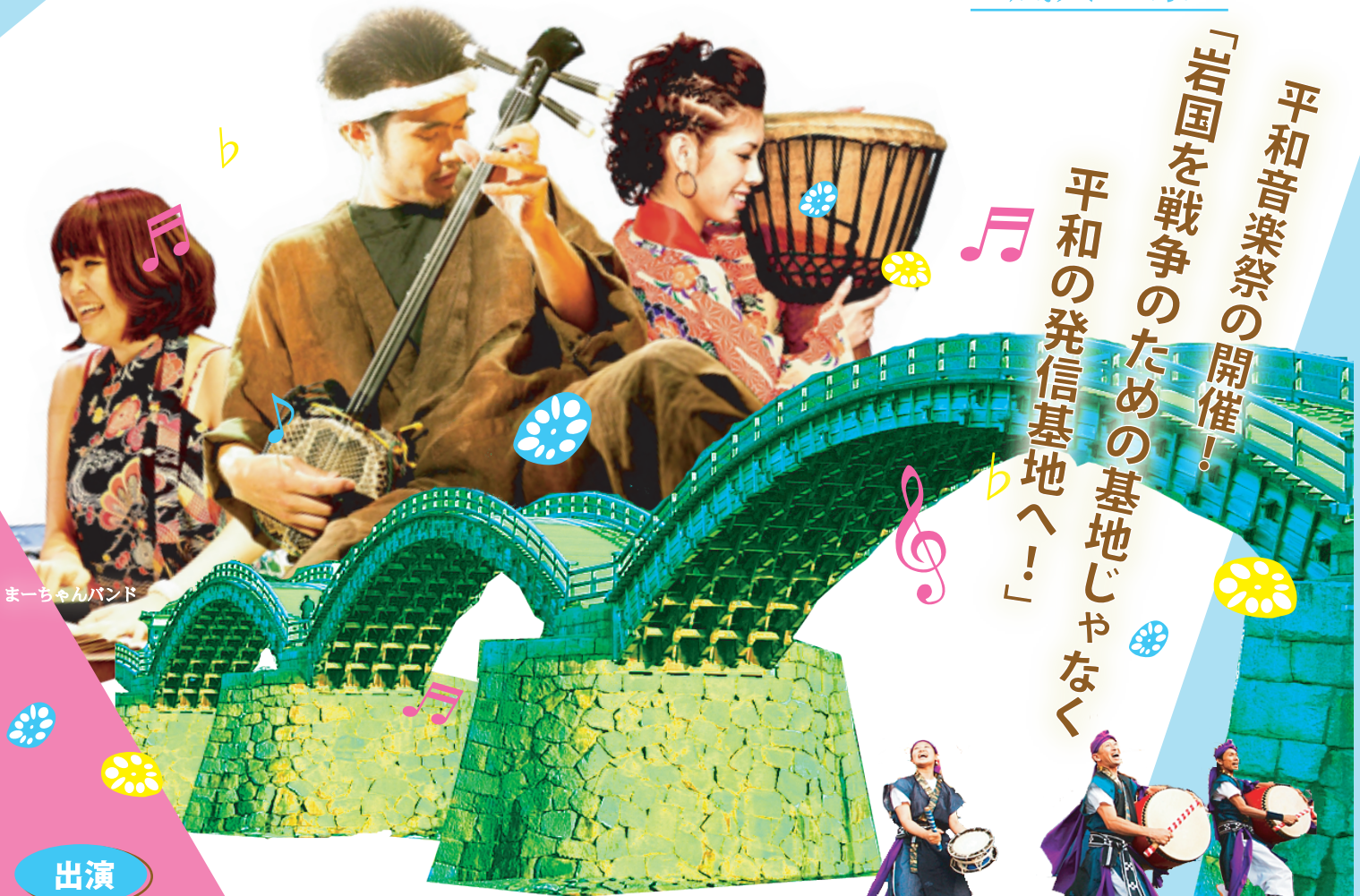
まーちゃんバンド