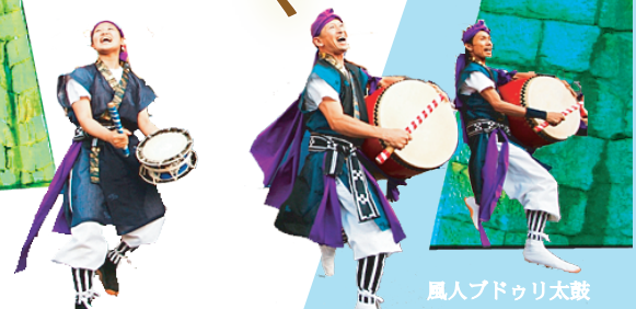
風人ブドウリ太鼓