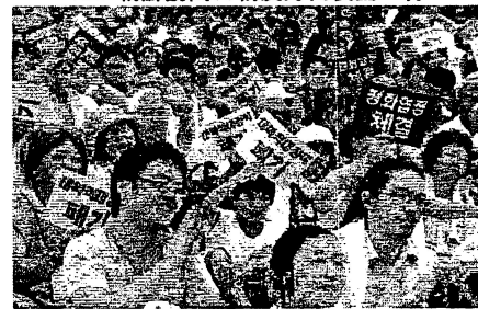
7/27、国際平和大会がソウルにて開催