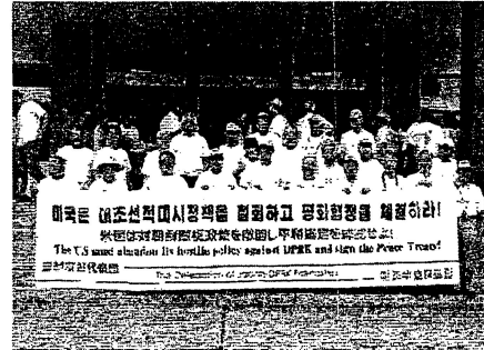
7.27 朝鮮訪問日朝友好代表団一行

私たちは、今こそ動き出す時だとの認識のもと、日朝国交正常化の早期実現に向けた講演会を企画しました。たくさんのご参加を呼びかけます。